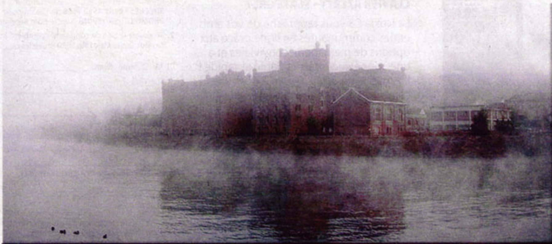
► Les moulins de Beez, dix ans plus tard. Afin de visualiser sa toute première photo de ces moulins, rendez-vous sur fugitif.net .